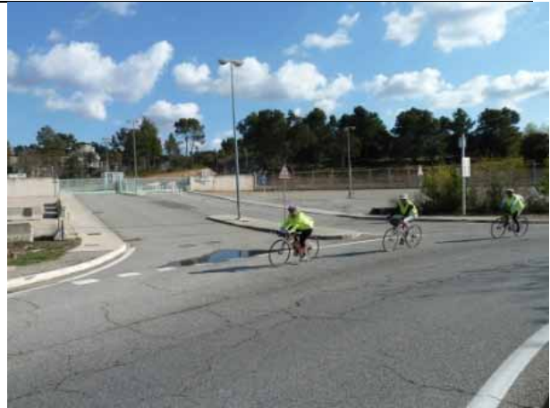
Sur la route...

Plus on approche de Manosque, plus le ciel paraît menaçant. Va-t-on réussir à rentrer avant la pluie ?