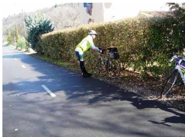
Sur le vélo route du Calavon, peu avant Apt... arrêts « grignotage, technique »...