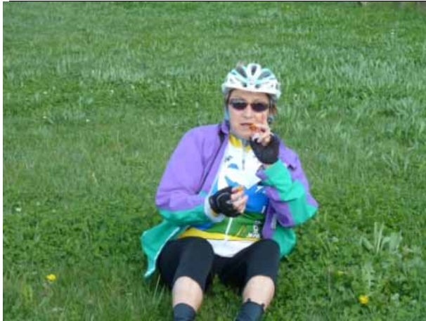
Ouf !!! elle est saine et sauve.