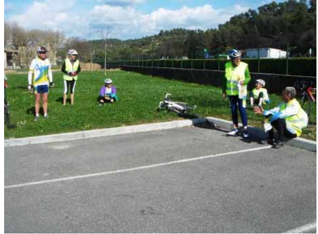
Arrêt pointage à Saint-Paul-Lez-Durance et pause grignotage... on approche de la fin du périple.